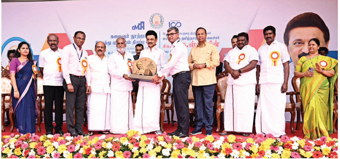
மாண்புமிகு தமிழ்நாடு முதலமைச்சர் அவர்கள் கிளாம்பாக்கத்தில் அமைந்துள்ள “கலைஞர் நூற்றாண்டு பேருந்து முனையத்தினை” 30.12.2023 அன்று திறந்து வைத்தார்கள்