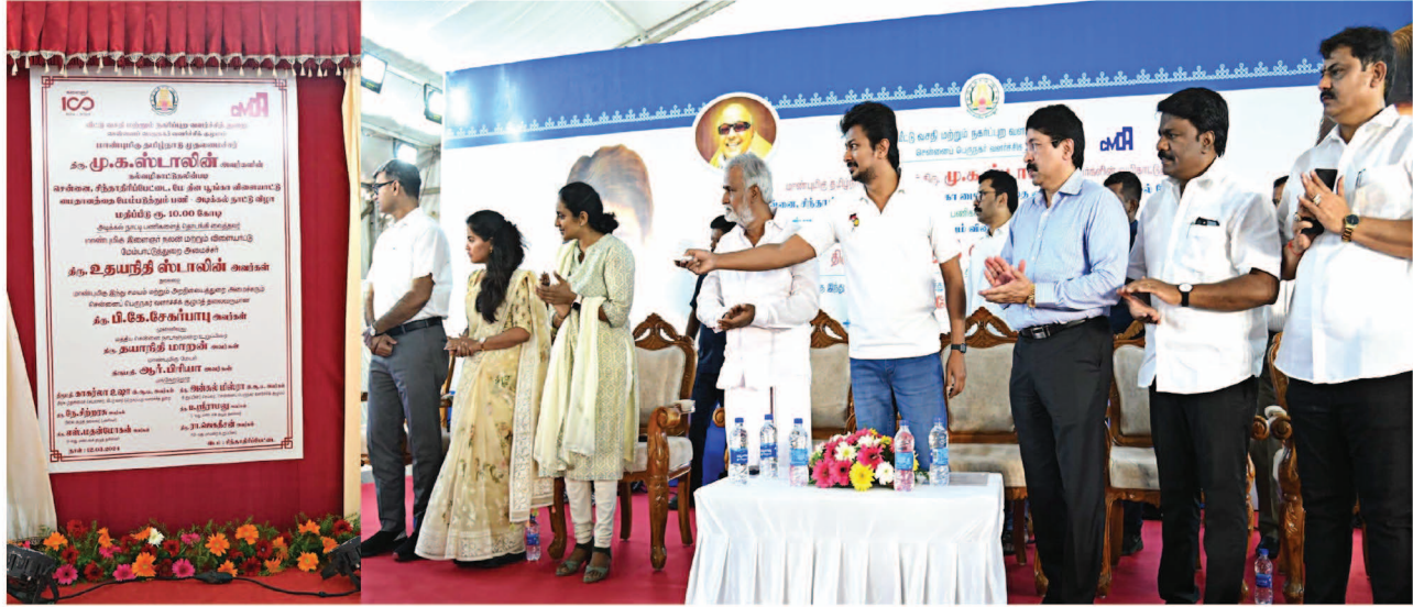
மாண்புமிகு இளைஞர் நலன் மற்றும் விளையாட்டு மேம்பாட்டுத்துறை அமைச்சர் அவர்கள் ரூ. 10 கோடி மதிப்பிலான நகர்ப்புற வளர்ச்சித் திட்டப்பணிகளுக்கு 12.03.2024 அன்று அடிக்கல் நாட்டினார்கள்