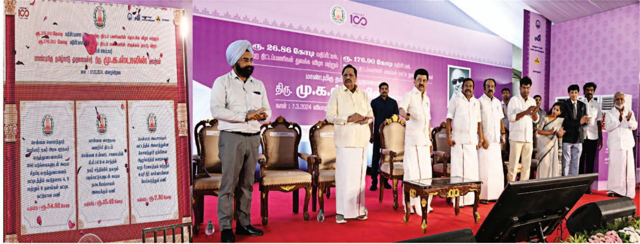
மாண்புமிகு தமிழ்நாடு முதலமைச்சர் அவர்கள் ரூ. 203.76 கோடி மதிப்பிலான நகர்ப்புற வளர்ச்சித் திட்டப்பணிகளுக்கு 07.03.2024 அன்று அடிக்கல் நாட்டினார்கள்