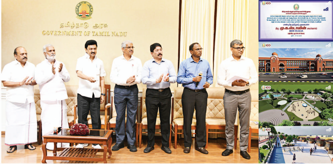
மாண்புமிகு தமிழ்நாடு முதலமைச்சர் அவர்கள் ஈ. 558.45 கோடி மதிப்பிலான நகர்ப்புற வளர்ச்சித் திட்டப்பணிகளுக்கு 27.02.2024 அன்று அடிக்கல் நாட்டினார்கள்